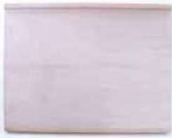
Art.Nr. 491599/494503 Backbrett Royal Holz, 40x60 cm € 9,99 Holz, 68x48 cm € 14,99