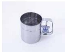
Art.Nr. 491310 Mehl/Staubzucker Drücksieb Royal 9x10 cm € 5,99