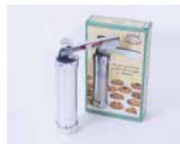
Art.Nr. 407421 Gebäckpresse Metall