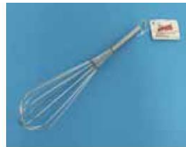
Art.Nr. 490942 Schneebeesen Eurohome Draht, 25 cm € 0,99