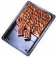
Art.Nr. 438572 Backblech antihft ausziehbar, 33-52 cm € 14,99