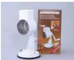
Art.Nr. 409316 Reibmühle mit Saugfuß, Metall