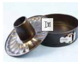
Art.Nr. 408503 Springform Atlas 26 cm, 3-tlg.