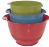
Art.Nr. 412805 Schüsselset Trudeau Melamin, 3-tlg. € 14,99