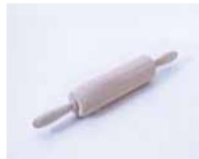
Art.Nr. 491597 Teigroller Buche, 23x6 cm € 5,99