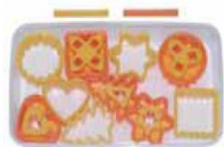
Art.Nr. 400025 Keksausstecher Doroplast, Linzer